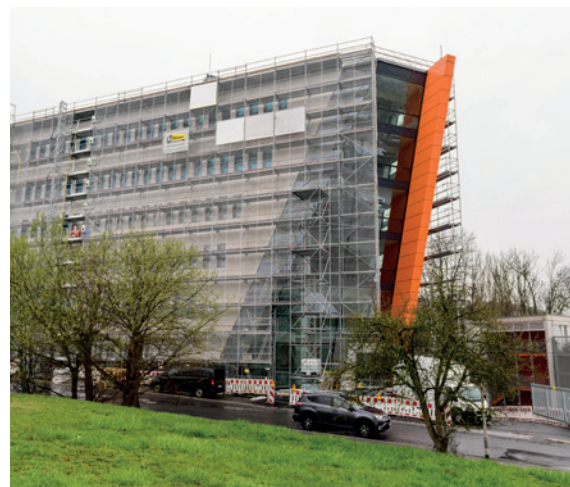
Neubau des Verwaltungsgebäudes bei der Schlüter-Systems KG in Iserlohn.

geschulten und motivierten Mitarbeiter und der moderne Maschinenpark des Iserlohner Bauunternehmens.